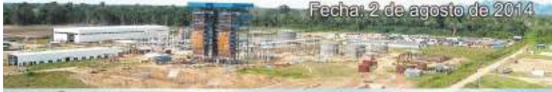
Fecha: 2 de agosto de 2014