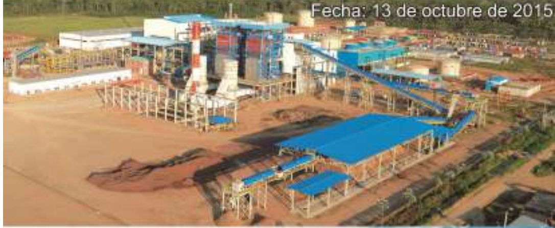
Fecha: 13 de octubre de 2015