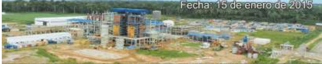
Fecha: 15 de enero de 2015