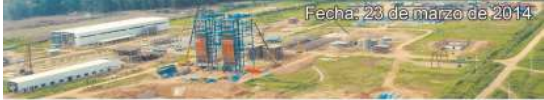
Fecha: 23 de marzo de 2014