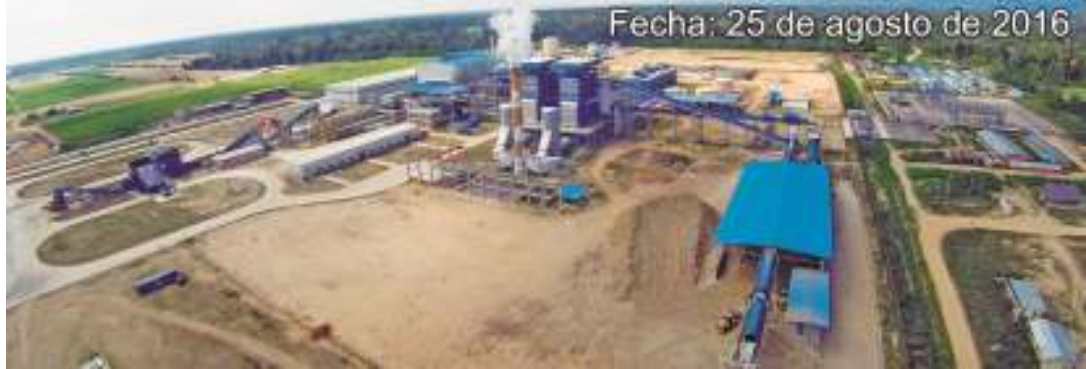
Fecha: 25 de agosto de 2016